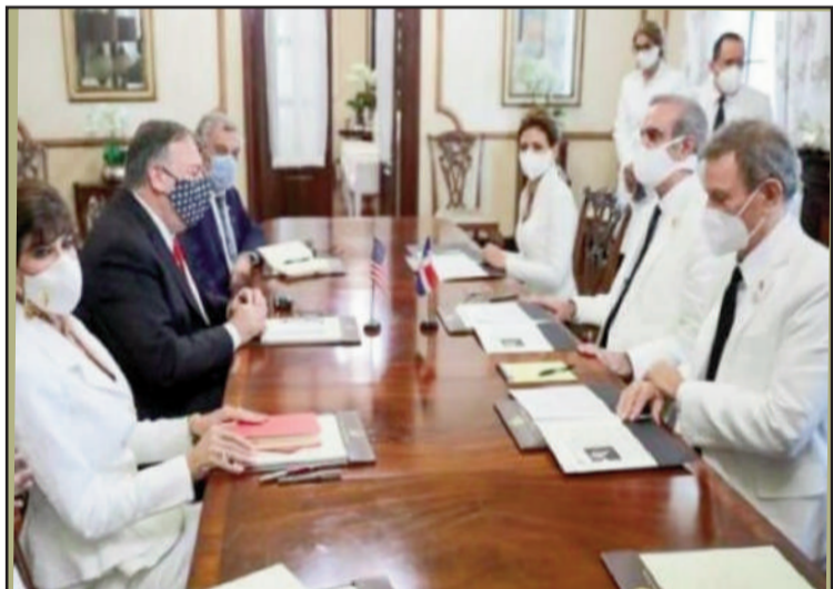
Quel contraste, le président Abinader, en face de Pompeo, avec la vice-présidente Raquel Pena, à droite de M. Abinader et les officiels dominicains et américains, lors d'une séance de travail.

Si le casier judiciaire de Jovenel Moïse ayant prêté serment comme président de la République d'Haïti, sous le coup d'une inculpation pour blanchiment d'argent, n'avait pas fait de lui un pestiféré auprès des dirigeants étrangers, les crises et les crimes qui caractérisent son administration ont fini par le rattraper. Sa visite à Santo Domingo, dimanche (16 août), à l'occasion de la cérémonie de prestation de serment du nouveau chef d'État dominicain, Luis Abinader Corona, l'a mis face à la réalité. La rencontre que la machine de propagande du Palais national pré-