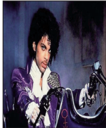
Prince, le super-entertainer, était d'origine créole.

par les colons, c'était d'acheter des esclaves, autant que possible, tandis qu'ils étaient très jeunes. C'est pourquoi, environ 60 % d'entre eux n'avaient pas vingt ans et pour cause. À cet âge, leur instinct de préserver leur identité et leur culture était moins déve-