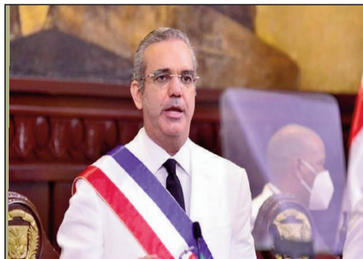
Luis Abinader en su primer discurso presidencial.

El Presidente Abinader, en su discurso de la ocasión, no sólo retomó el tema principal de su campaña, el cambio, cuyo aspecto más importante