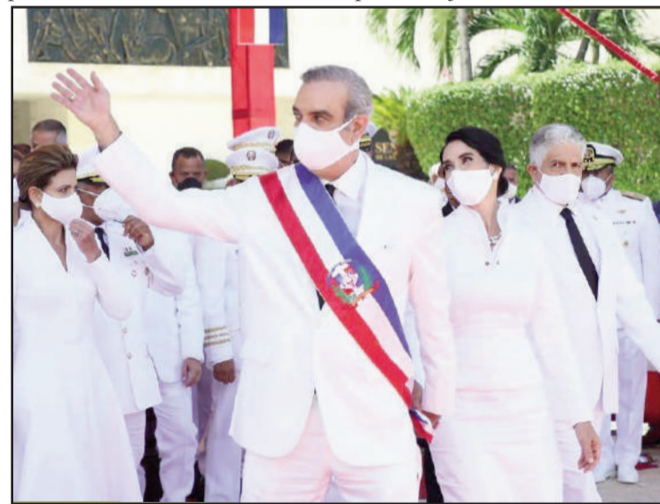
Après son investiture, le président Abinnadedr, avec sa femme Raquel Arbaje, à sa gauche, et la vice-présidente Raquel Peña, à sa droite.

pots-de-vin de USD 92 millions $ versés par cette multinationale brésilienne. Odebrecht payait cette somme d'argent en contrepartie de juteux contrats de tra-