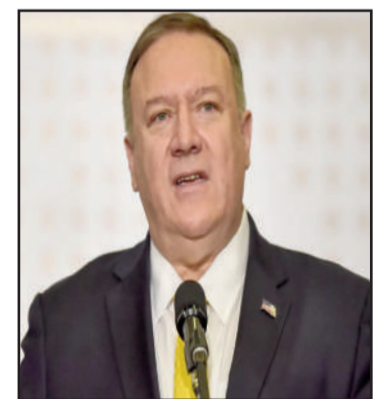
American Secretary of State Mike Pompeo.