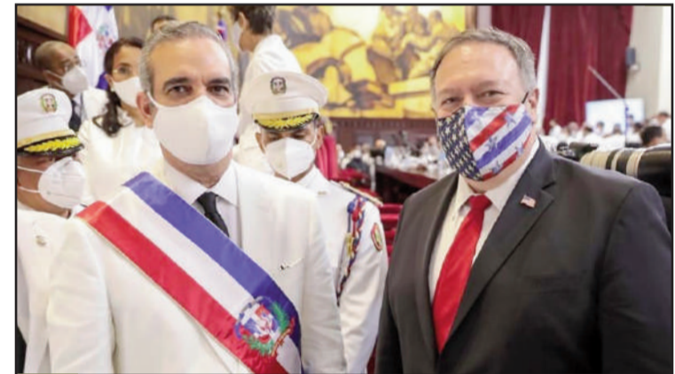
Prestation de serment, le président Abinader, avec le secrétaire d'État américain Mike Pompeo.

der fait son entrée au Palais national, à Santo Domingo, doté de pouvoirs étendus pour exécuter son projet de société. Accroché à ses discours de campagne et sa promesse de « changement », ses concitoyens lui ont octroyé un mandat solide, en sus d'un Parlement et des municipalités pour qu'il puisse concrétiser le rêve que ces derniers partagent avec lui. L'un des rares chefs d'État dominicains à être élu au premier tour, sa présidence est gratifiée d'une majorité parlementaire à trois niveaux : 18 sénateurs sur 32, 93 députés sur 190 et 81 municipalités sur 158. Voilà un mandat historique solide ! Monsieur le Président, n'y vas pas de main morte !