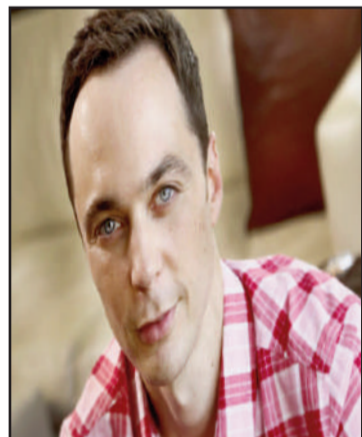
L'acteur-comédien Jim Parson, fils de l'architecte français Louis-François Trouard, rend hommage à son origine créole.

Entre temps, dans la partie occidentale de l'île, les Français continuèrent à recevoir des noirs pour venir cultiver la canne à sucre dans leurs plantations. Ces nouveaux arrivants issus de presque tous les coins d'Afrique ne se connaissaient pas et les uns n'arrivaient pas à comprendre le dialecte des autres. L'explosion démographique de ces esclaves devenait tellement importante qu'elle finit par créer une nouvelle langue : le « créole ».