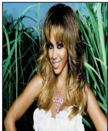
La chanteuse Beyoncé prône son héritage créole, descendante du héros arcadien Joseph Broussard.