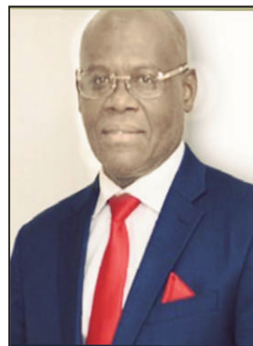
Premier ministre Joseph Jouthe, au bout de son rouleau ?

Le tout dernier rapport mis en circulation par la CSC/CA (le 17 août 020) accable encore plus les dilapidateurs du Fonds PetroCaribe. Si les mêmes individus précédemment dénoncés font encore l'objet d'accusations plus graves, les juges de cette institution attirent l'attention sur les firmes engagées