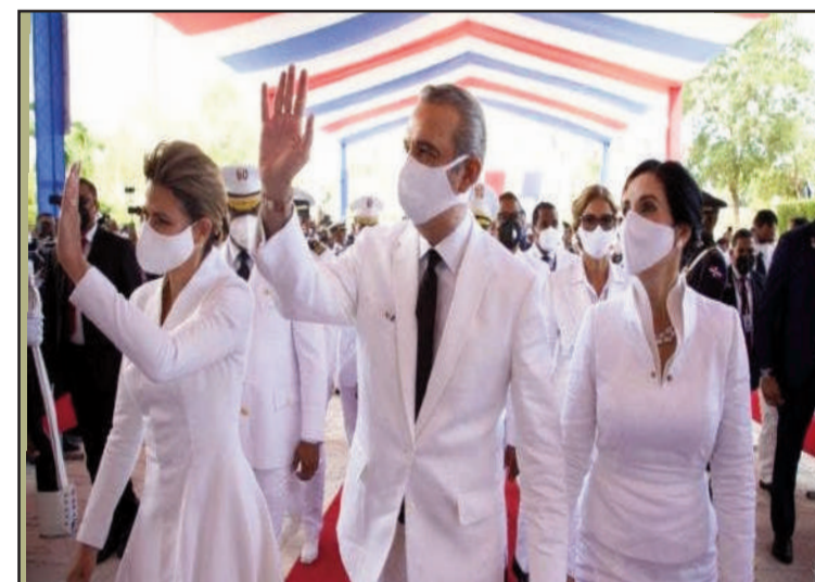
El presidente electo Luis Abinader y su esposa, Raquel Arbage, a su izquierda, con la vicepresidenta electa Raquel Peña entrando al Parlamento.

Antes de tomar la palabra por primera vez como Presidente, Luis Abinader fue precedido por Eduardo Estrella