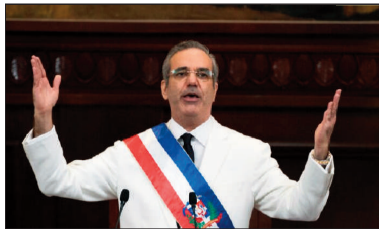
Le président Luis Abinader dans son discours d'investiture.

de ni facile, surtout que le pays se trouve confronté à un déficit de 25,6 milliards de pesos. Malgré tout, il promet d'assurer la sécurité alimentaire quand bien même la gravité de la crise serait déconcertante.