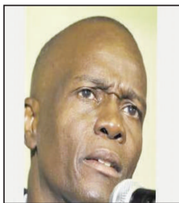
Haitian President Jovenel Moïse.

When “propagandists and fabricators” misuse the name of a prominent journalist