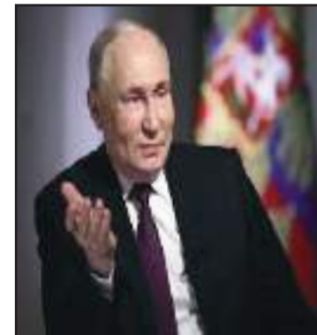
Vladimir Poutine, un des acteurs originaux de la guerre en Ukraine.

Dans le milieu haïtien, que ce soit au pays ou en diaspora, la nouvelle, qui a fait la une, reste le départ de Franckétienne pour l'au-delà. À l'âge de 88 ans, cette icône de la culture haïtienne ( Gwo Mapou , en créole) a fait le voyage éternel le 20 janvier.