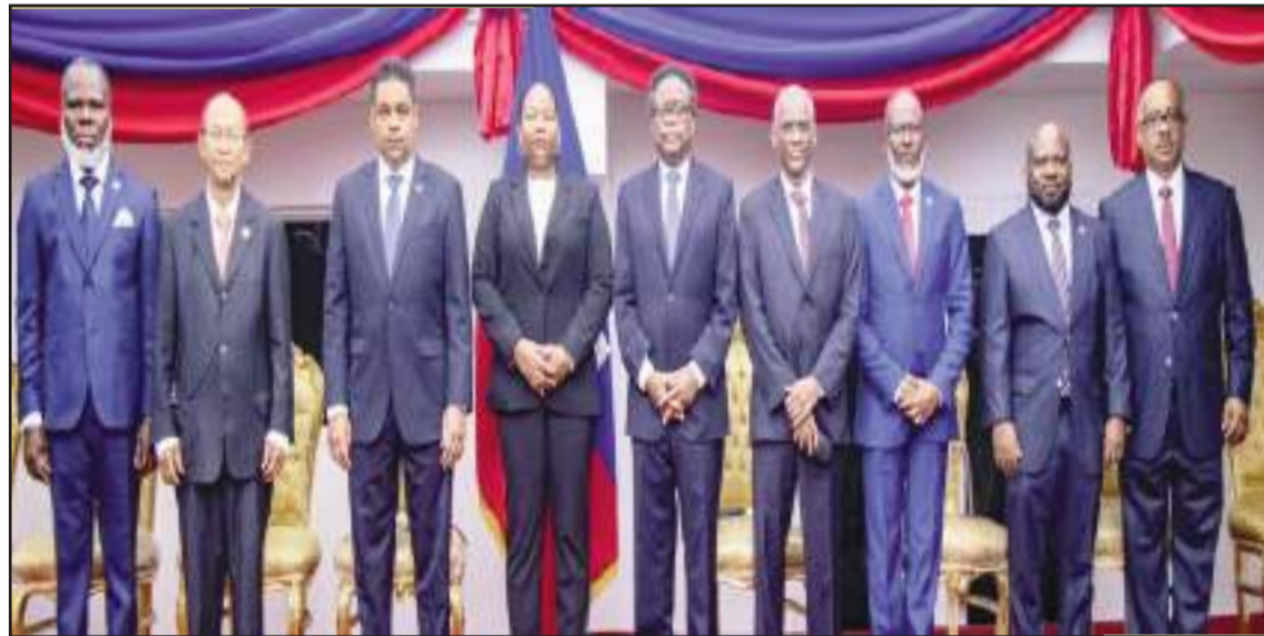
Men gwosè pil fache pèp la kont nèt manm Konsèy prezidansyèl la, sitou akoz 3 dwèt long ki pami yo. π

man an pral fè menm bagay la nan Fort Liberté , paske se zafè pa yo. Alò, se pou yo pran oserye konsèy mwen bay la. Jwenn youn rezon pou sispann kesyon kanaval sa a, epi itilize 52 milyon goud la, e plis ankò, pou rezoud pwoblèm mwen te mansyonnen yo, an kòmansan pa pwobèm Polis la. Li lè li tan, pou CPT a (Konsèy prezidansyèl 9 tèt la) sispann kite yo pase yo nan betiz. Depi yo an egzistans, nan mwa avril 2024, prèske 10 mwa gentan