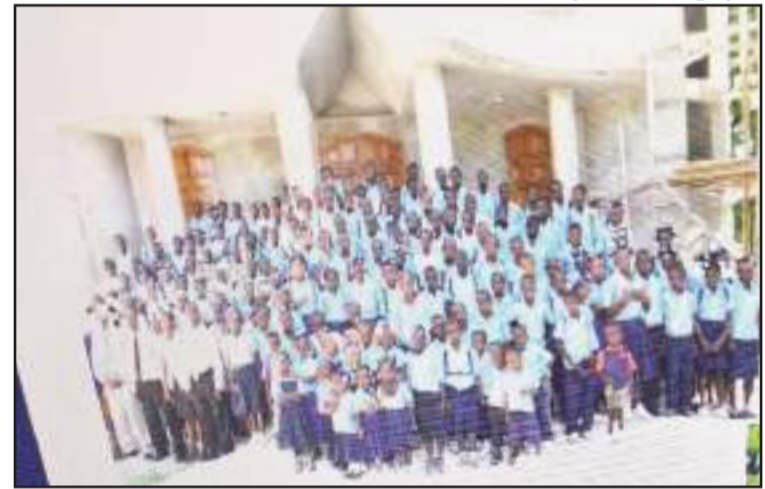
L'école primaire de Jonc Dodain d'Aquin, photo souvenir, les élèves et le personnel enseignant.

Après que le projet de construction de maisons à bon marché, au profit des victimes du tremblement de terre dévastateur du 12 janvier 2010, qu'avait conçu M. Gourdet, eut tourné court, à la suite de l'assassinat du président Jovenel Moïse, celui-ci a investi toutes ses ressources dans la réali-