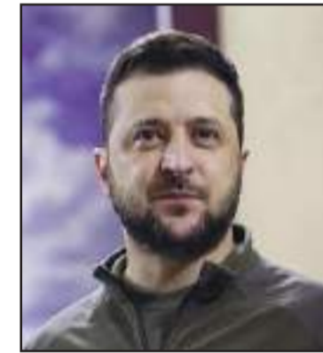
Volodymyr Zelensky, l'acteur de la guerre en Ukraine qui a survécu les prédictions de Vladimir Putin.

Dimanche dernier, 23 février, un soldat kényan a trouvé la mort, lors d'un accrochage avec des gangs armés, dans l'Artibonite. Grièvement blessé, il a été transporté en hélicoptère à l'hôpital, où il a succombé à ses blessures.