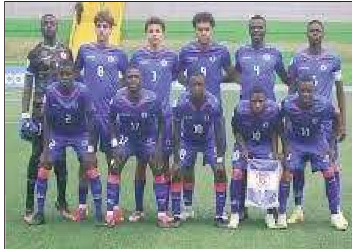
L'équipe U17 d'Haïti en route pour participer à la Coupe FIFA 2025.

peuplement qui se faisait il y a peu en Haïti ! Brutalement interrompu ! Mes coaches et cadres techniques des sélections et éducateurs de jeunes tous révoqués et presque exilés aux USA et en Dominique ; aujourd'hui dans le maquis pour ne pas être déportés