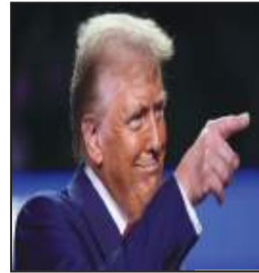
Donald Trump, le nouveau acteur de la guerre en Ukraine.

Le 18 février, en Arabie saoudite, des officiels russes ont rencontré leurs homologues améri-