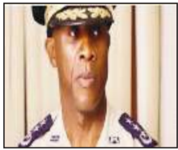
Rambeau Normil, directeur général de la PNH, tarde à trouver la bonne formule pour mettre les gangs armés en déroute.