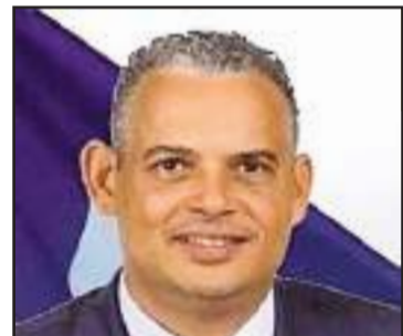
Alix Didier Fils-Aimé, Premier ministre, ne semble pas savoir quand donner l'ordre d'en finir avec les bandits ou n'en a pas encore reçu vert du CPT.