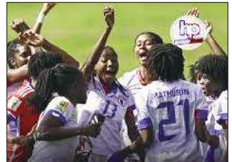
Les dernières révélations intéressante au sein des Grenadières.

championnats étrangers, donc sont hautement compétitifs, même si les dirigeants prennent la précaution d'éviter des adversaires de poids ou de renom pouvant les épargner des défaites, parce que la préparation des matches est désastreuse, notamment sans stages rigoureux et une mise en place sans consistence. Le pire, les joueurs ont peur de dénoncer, n'étant plus rappelés en sélection s'ils osent dénoncer, ou même manifester leur désarroi. Les cas pullulent, mais une bonne partie des ressources du football sert à payer et soudoyer des propagandistes des réseaux sociaux.