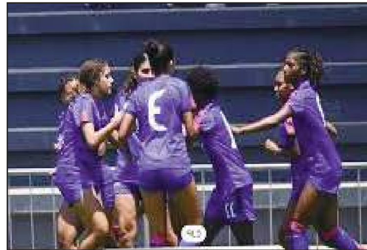
Les petites Grenadières, les moins de 17 ans., encaissent leur défaite au Mexique.

technique et physique de leurs adversaires. Elles ont concédé deux lourdes défaites : un cinglant