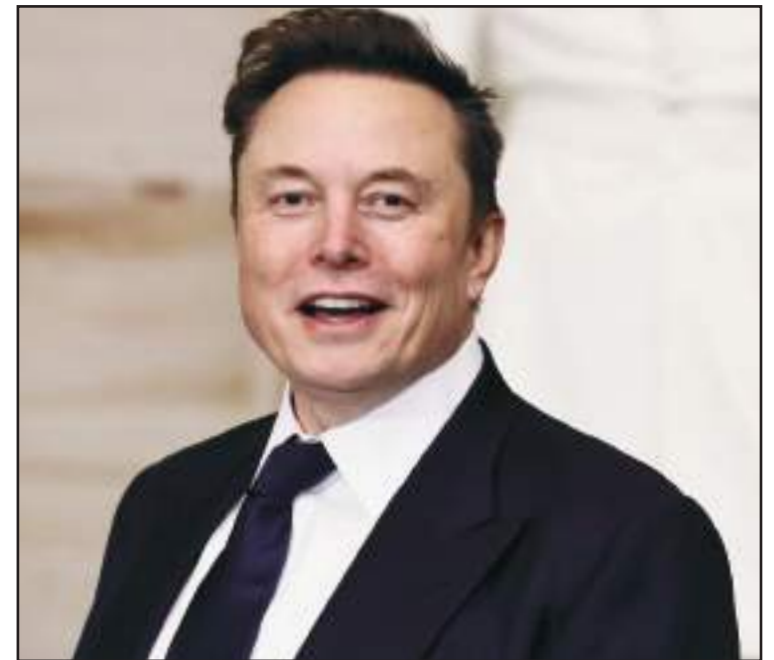
Elon Musk, un moment de désaccord est toujours possible.

Les actions du président Trump ont affecté les bourses d'échange de nombreux pays, à commencer par la Bourse américaine de New York. Selon les statistiques publiées, depuis la prise du pouvoir, le 20 janvier, par le président Trump, la Bourse de