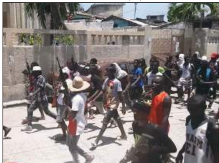
Plus de 500, détenus se sont évadés de la prison civile de Mirebalais, évadés par les criminels de Viv Ansanm.

En tout cas, désormais l'incertitude s'installe dans le département du Centre et des villes frontalières. On ignore exactement ce qui se passe dans ces régions. Même quand des sources proches du gouvernement déclarent que les forces de l'ordre ont pu chasser les gangs, qui avaient capturé Mirebalais et y semé la terreur, aucune précision n'a été apportée, de manière à rassurer les citoyens qui l'avaient désertée. Quand bien même les autorités gouvernementales auraient émis des communiqués rassurants, par rapport à l'efficacité de ses ripostes, les populations reçoivent de telles informations avec un grain de sel. En tout cas, jusqu'à ce qu'un autre assaut des gangs armés vienne démentir les revendications de la Police. C'est, d'ailleurs, ce qui arrive après chaque affrontement entre les forces de sécurité