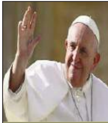
Le pape François

mant qu'il était hors du commun, en tant que chef suprême de l'Église catholique universelle. Parmi tant d'autres, je souligne le témoignage d'un pasteur protestant concernant le pape François. Il s'agit du sénateur afro-américain de Georgia, Raphael Warnock, qui est aussi pasteur de l'Église baptiste Ebenezer, à Atlanta, ayant été précédé à cette chai-