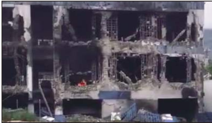
Le commissariat de Martissant incendié par les gangs armés.

Selon cet organe de presse, des hommes lourdement armés, affiliés au gang « Gran Grif », ont dirigé une agression violente sur cette communauté, enlevant neuf personnes contre rançon et exécutant une autre, qui tentait de prendre la fuite, en sus de 13 maisons incendiées et de deux autres habitants du même quartier blessés, dont un vieillard et un adolescent, aussi bien qu'un dispensaire et une école