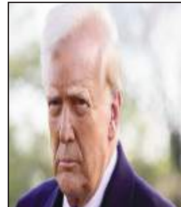
Le président américain Donald Trump

nier jour de ce mois qui débute par le jeu dit « Poisson d'avril », marque les 100 premiers jours de la deuxième présidence de Donald Trump et l'on attend le verdict du public, quant au score à lui donner pour sa performance durant ces trois mois. On doute, toutefois, que ce sera positif, se démarquant des 100 premiers jours de son premier