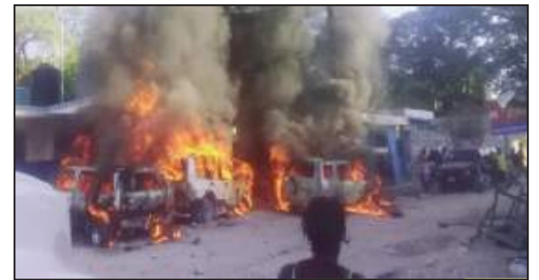
Le commissariat de Montrouis livré aux flammes par les bandits.

Toutes choses considérées égales, quand on parle de la disparition de l'État haïtien, plus on examine le cas, davantage se précise la cohérence du projet. Car tout semble indiquer l'exécution d'un plan, qui passe par l'autodestruction de l'institution policière, chaque directeur général de la PNH ayant son quota de commissariats à rendre dysfonctionnels, donc à affaiblir progressivement les forces de l'ordre. Aussi