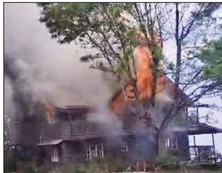
L'auberge Le Montcel, qui a été incendié par les gangs.

oublier, les gangs intensifient leurs attaques sur les communautés et affichent avec plus d'audace encore leur défi aux forces de sécurité du pays. Une réalité pro-