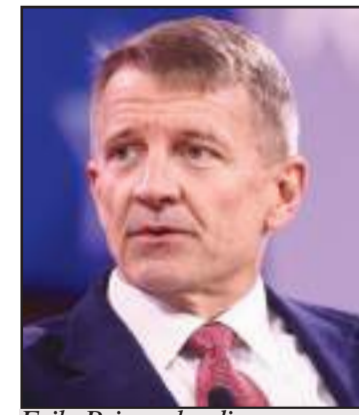
Erik Prince leading a gang-fighting brigade discreetly.

In less than four months, on February 7, 2026, the experiment of plural governance of Haiti, instituted by the International Com-