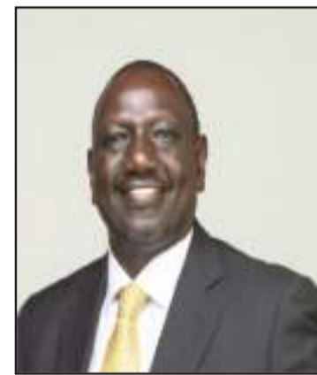
Le président du Kenya William Ruto.

dirigée par le Kenya, elle ne constitue pas un échec annoncé.