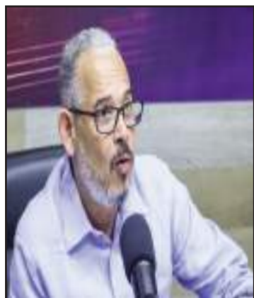
Le Premier ministre Alix Didier Fils-Aime se plie, de manière consentante, à toutes les décisions made in Washington, au détriment d'Haïti, de concert avec le CPT.