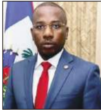
Claude Joseph removed from the Prime Minister's Office by the CORE Group.

became a reality. Now the "Viv Ansanm" (Creole for Live Together ) has become an expanded gang confederation, operating first in Port-au-Prince and surroundings, and spreading out to Haiti Central Highlands, called "Plateau Central" in French. Under the leadership of former Poli-