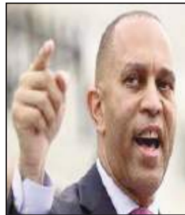
Le député démocrate Hakeem Jeffries

blant le sobriquet de « ICE » ont débarqué en force. À Canal Street, au bas de la ville, ils arrêtaient les marchandes ambulantes, aucune blanche parmi elles, et