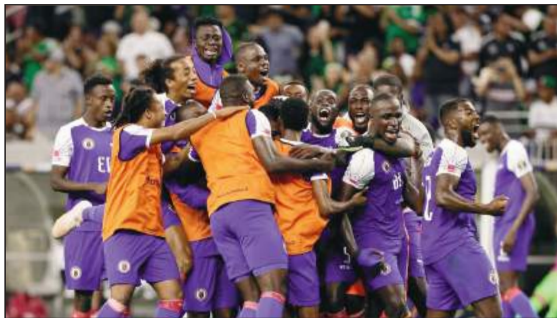
L'équipe nationale d'Haïti, qui a été humiliée par celle de Honduras.

Conseil présidentiel a même eu à féliciter l'équipe pour sa qualification.