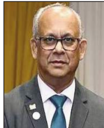
Le secrétaire général de l'OEA, Albert Ramdin.