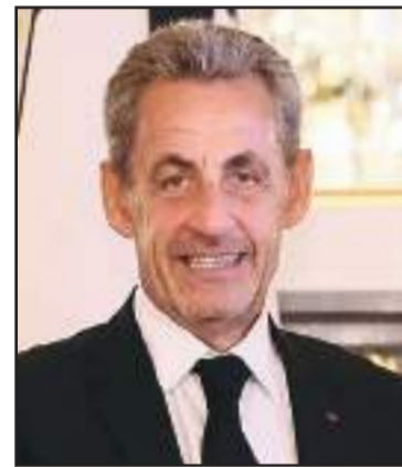
L'ex-président de France Nicolas Sarkozy

En effet, il y avait des victimes, ce jour du 6 janvier, même dans les rangs de la Police. Toute fois, des assaillants, arrêtés, ont connu la prison. Mais, Donald