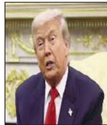
Le président américain Donald J. Trump

De quoi s'agit-il ? Pour financer sa campagne électorale, en 2007, le politicien de la droite française avait pratiqué la corruption à haut niveau, hors des frontières de son pays. Dans une entente en catimini, Sarkozy avait