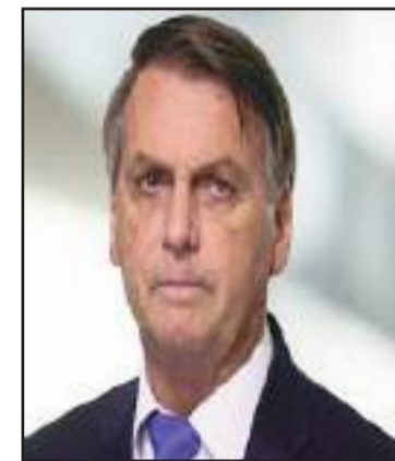
L'ex président du Brésil Jair Bolsonaro