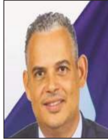
Le Premier ministre Alix Didier Fils-Aïme, a fond dans le complot électoral, avec le CPT.

À la capitale haïtienne, les attaques des gangs armés continuent de se perpétrer, également